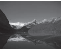
Grâce à EF Educational Tours

Points saillants : Calgary : la tour de Calgary, le Temple olympique de la renommée, l'Anneau olympique, la rivière Bow et le parc Stampede. Banff : les chutes Bow, le lac Minnewanka et la Sulphur Mountain Gondola. Les élèves visiteront également le lac Louise, les champs de glace Columbia, le parc national Jasper et le Musée royal de paléontologie Tyrell et feront une excursion en Snocoach sur le glacier Athabasca.