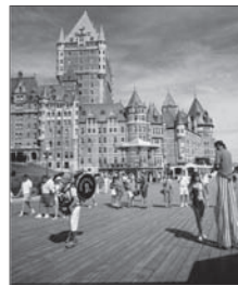
Grâce à Prométour

Prix : À partir de 429 $* pour 5 jours/4 nuits d'hébergement. Inclut le transport en autocar de luxe, en minibus et en train, tous les petits déjeuners et les dîners, des guides locaux bilingues, un accompagnateur 24 heures sur 24, les taxes et frais de service. Comprend uniquement la portion terrestre.