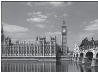
Grâce à EF Educational Tours

Prix : Entre 1 185 $ et 3 870 $* pour 7 à 10 jours, incluant le transport aérien, cinq nuits à l'hôtel, tous les petits déjeuners et les dîners, un accompagnateur bilingue, quatre visites touristiques animées par des guides locaux, cinq visites d'attractions spéciales, deux visites à pied guidées et deux séances d'information sur la visite touristique.