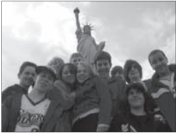
Grâce à Prométour

Prix : À partir de 369 $* pour 4 jours/3 nuits. Inclut tous les petits déjeuners et les dîners, toutes les taxes et les frais de service, les déplacements en autocar de luxe, en minibus et en train, les guides locaux bilingues, une visite privée (aucune autre école ne prendra part au même voyage). Comprend uniquement la portion terrestre.