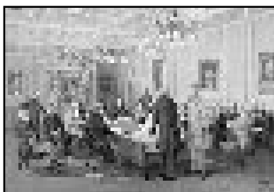
Les Pères de la Confédération à la Conférence de Londres, 1866. © J.D. Kelly, Archives nationales du Canada

www.radiocanada.ca (chercher Confédération)