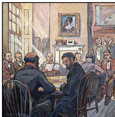
Premier Conseil législatif de la colonie unie de Colombie-Britannique, 1867

www.cprheritage.com/history/CPRtimeline.pdf , www.cprheritage.com/fr/histoire/index.htm