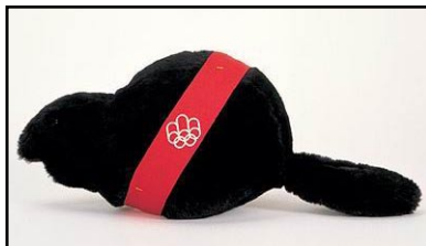
Amik, le castor, mascotte de 1976

www.mapsofworld.com/olympic-trivia/olympic-motto.html (en anglais seulement)