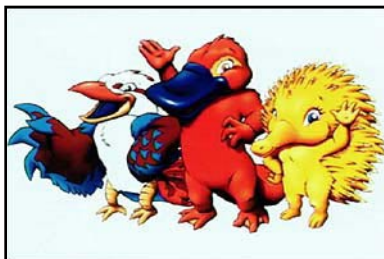
Olly le kookaburra, Syd l'ornithorynque et Millie l'échidné les mascottes des Jeux olympiques de 2000 à Sydney, en Australie

de l'excellence en sport. À un autre, ils constituent un événement mondial pour le divertissement de millions de spectateurs. Chaque athlète veut gagner. Chaque pays veut que ses équipes excellent. Les Jeux olympiques sont régis et administrés par le Comité international olympique (CIO) qui a son siège à Lausanne, en Suisse. Le CIO a été créé en 1894, dans le but de réorganiser des Jeux olympiques, ce qu'il a fait en 1896 quand les premiers Jeux des temps modernes ont eu lieu, comme il se devait, à Athènes, en Grèce. Depuis 1972, chaque édition des Jeux olympiques a eu une mascotte ou un personnage représentant l'esprit de la compétition et le thème sélectionné par le pays hôte.