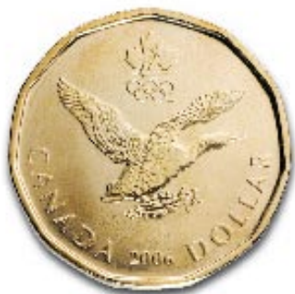
Le dollar porte-bonheur des Jeux olympiques d'hiver de 2006