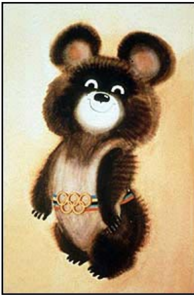
L'ours Misha des Jeux olympiques d'hiver de 1988 à Moscou