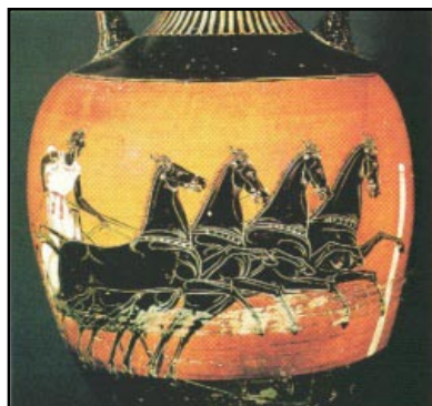
Vase grec, Ve siècle avant J.-C.

Nous savons une chose des athlètes olympiques, c'est qu'ils se consacrent entièrement à leur sport pour se dépasser et exceller. Au Canada, un grand nombre d'athlètes olympiques, voire la plupart, reçoivent une subvention quelconque du gouvernement fédéral. De nombreux athlètes tout en continuant à s'entraîner, doivent compléter ce revenu de diverses façons : certains ont des commanditaires ou reçoivent l'aide de leur famille ou encore recueillent des fonds. Les Jeux olympiques ont lieu tous les quatre ans. Entre les Jeux, les athlètes continuent de s'entraîner et de participer à des compétitions. Il est toutefois important de reconnaître l'engagement et le dévouement des athlètes olympiques dans la quête du sommet dans les sports.