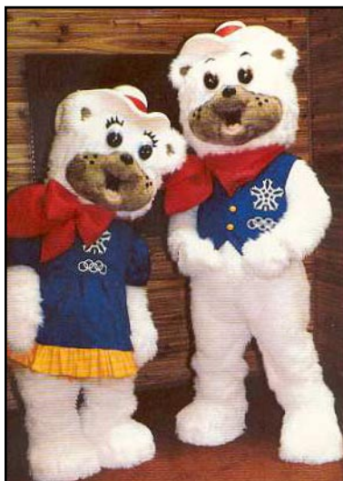
Les mascottes olympiques Hidy et Howdy, Calgary, 1988