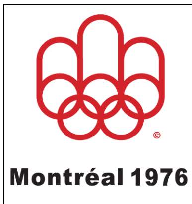
Logo des Jeux olympiques de 1976 à Montréal